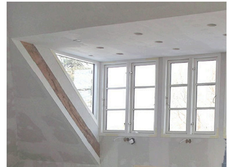
Referencebillede: Ny kvist med glasflunk