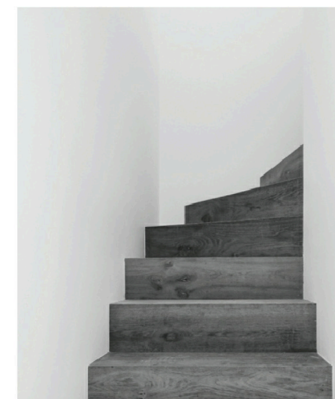
Referencebilleder: Ny halvsvingstrappe